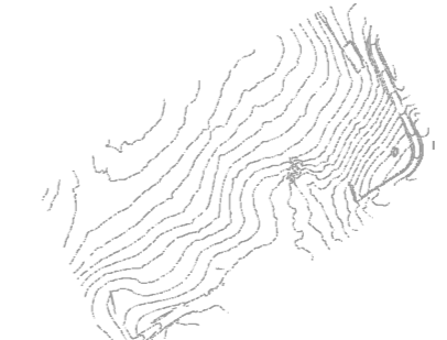
Altimetria 2 x 2 m